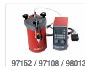
97152 / 97108 / 98013

Das System eignet sich zum Dosieren von niedrig- bis mittelvviskosen LOCTITE Sofortklebstoffen in Form von Punkten oder Raupen. Es kann in automatisierte Montagestraßen integriert werden. Das Membran-Dosierventil mit Präzisions-Hubverstellung erzielt tropfenfreie Dosierung. Über das Steuergerät erfolgt die Ansteuerung von Ventil und Tank sowie die Startauslösung über Fußschalter, Tastatur oder übergeordnete SPS.