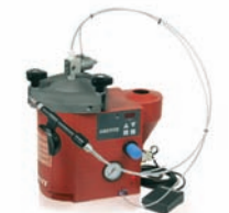
97009 / 97121 / 97201

Das Halbautomatische LOCTITE Dosiersystem ist eine integrierte Konstruktion von Steuergerät und Tank für die Dosierung von vielen LOCTITE Schraubensicherungen mit Hilfe von Ventilen. Mit digitaler Zeitsteuerung, Leermeldung und Fertigmeldung. Quetschdosierventil für die Dosierung im Handbetrieb oder als stationäres System. Die Tanks sind groß genug für die Aufnahme von 2-kg-Flaschen und die Geräte können mit einer Füllstandsüberwachung ausgerüstet werden.