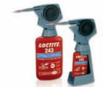
97001 / 98414

Diese Geräte können einfach auf jede 50 ml- oder 250 ml-Flasche aufgeschraubt werden. Sie machen das anaerobe LOCTITE Produktgebilde zu einem tragbaren Handdosiergerät. Sie ermöglichen das Dosieren in jeder Lage, in Tropfengrößen von 0,01 bis 0,04 ml - genau, ohne Tropfen oder Produktvergeudung (für Produkte mit einer Viskosität bis 2,500 mPa·s).